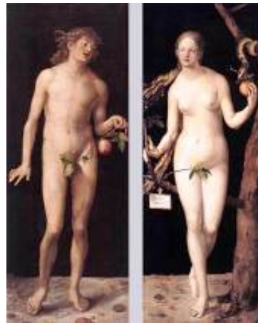
Albrecht Dürer, Adão e Eva 1507). Museu do Prado

O Conselho da EBP-SP continua a ministrar quinzenalmente seu Seminário, enfocando o Seminário 19 ... ou pior de Jacques Lacan.