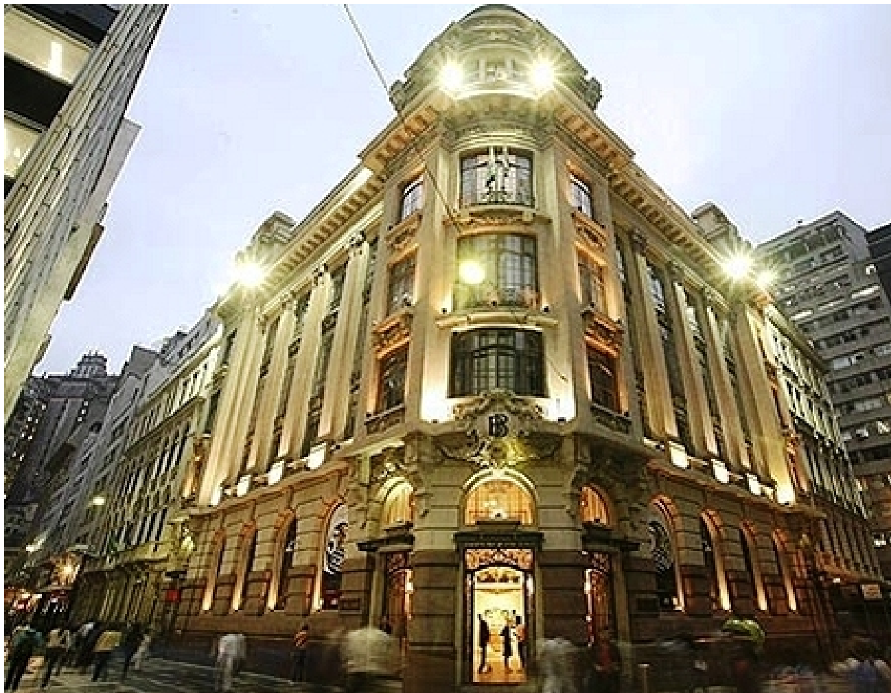
Centro Cultural Banco do Brasil - São Paulo