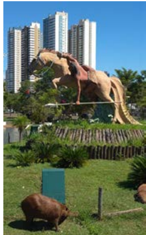
Fotografia 1 Monumento Guerreiro Guaicuru, por Ana Joyce Godoy dos Santos.

Ainda temos muito a apresentar, inclusive muita gente boa e talentosa que faz sucesso pelo Brasil. Por isso, convidamos e, desde já, damos as boas-vindas aos analistas