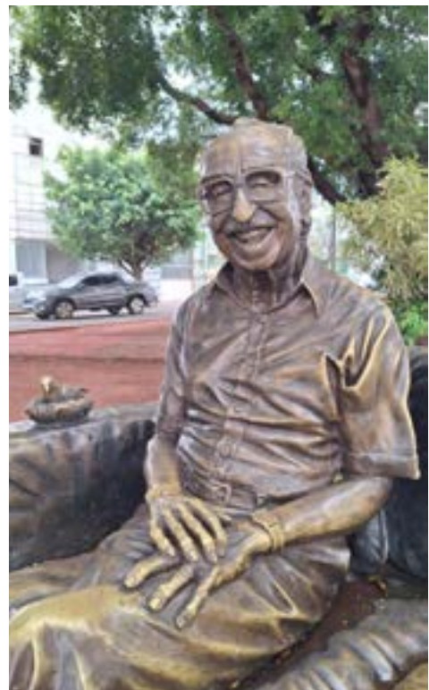
Fotografia 2 Monumento a Manoel de Barros, por Letícia Rosa.